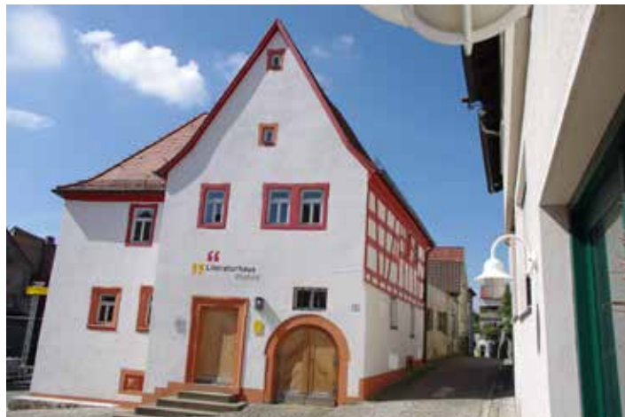
Ein Veranstaltungsort von vielen aus der Reihe „Kultur in alten Mauern“, das Literaturhaus Wipfeld. Hinweis: Dieses Bild ist nur in Zusammenhang mit der allgemeinen Berichterstattung zur Veranstaltungsreihe „Kultur in alten Mauern“ honorarfrei zu verwenden.

Weitere Informationen zu „Kultur in alten Mauern“ und die Kulturförderung des Landkreises Schweinfurt sind auf der Homepage www.landkreis-schweinfurt.de/kultur zu finden.