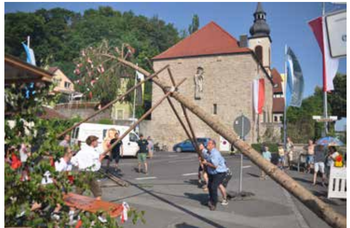
Doch noch von einer stattliche Höhe von 15 Metern weist der Kirchweihbaum in Mainberg auf.