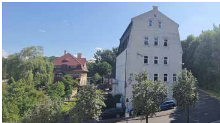
Künftig soll das Lebenshilfe-Areal eine Symbiose aus historischen Mühlengebäuden und modernen Schultrakten bilden. Eine große Errungenschaft stellt die künftige Durchgängigkeit des Geh- und Radwegs hin zum Main dar.

mit der Rathausspitze. In einem nächsten Schritt sollen die Pläne nun dem Fördermittelgeber, der Regierung von Unterfranken vorgelegt werden. Dabei kommt es auch auf die Zustimmung der Gemeinde an, da Grundstücksgrenzen bereinigt und Flächen zugekauft werden müssen. Weitestgehend unberührt bleibt der öffentliche Parkplatz am benachbarten Dürrgelände: Die Baumaßnahmen können vollständig auf dem bisherigen Gelände der Lebenshilfe realisiert werden. Bürgermeister Stefan Rottmann aber auch die Räte lobten die durchdachten Pläne, insbesondere auch, weil Flächen gespart und damit auch Innenentwicklung betrieben wird. Die Neubau- und Sanierungsmaßnahmen der Lebenshilfe sind das nächste Millionenprojekt, neben dem aktuell laufenden Grundschulneubau, dem bereits beschlossenen Neubau der Realschule in Schonungen und dem Umbau bzw. Renovierung der alten Grundschule in Schonungen.