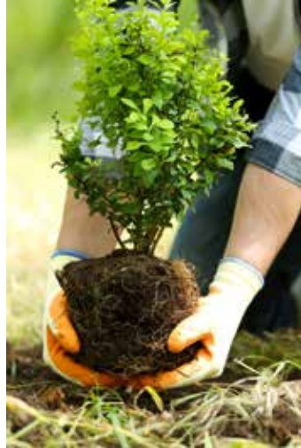
In vielen Städten und Gemeinden ist geregelt, was Gartenbesitzerinnen und -besitzer überhaupt pflanzen dürfen.

Aufgrund des Selbsthilferechts dürfen Äste und Zweige, die aufs Grundstück der Nachbarn herüberwachsen, von diesen abgeschnitten werden, wenn die Eigentümer des Baums zuvor über die Absicht unter Fristsetzung informiert wurden und es keine naturschutzrechtlichen Probleme gibt. „An Obst, das von überwachsenden Ästen auf ihr Grundstück fällt, dürfen sich Nachbarn bedienen. Man darf durch Schütteln der Zweige aber nicht selbst dafür sorgen, dass sich die Früchte vom Baum lösen“, betont Hannen rechtliche Feinheiten.