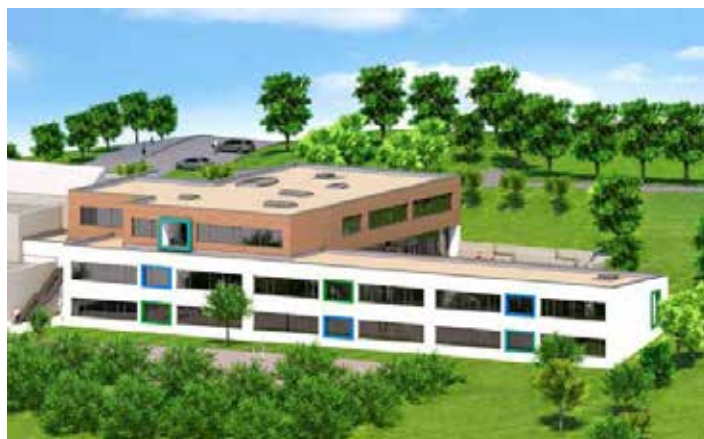
Fotomontage AB Philipp