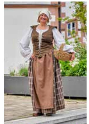
Gewandführung Magd Minna

Magd Minna entführt die Teilnehmer auf einem Rundgang durch das frühere Stadtleben von Schweinfurt. Minna erzählt von ihrem Leben im Hause der vornehmen Familie Höfel im 30-jährigen