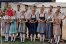
Kirchweih in Marktsteinach